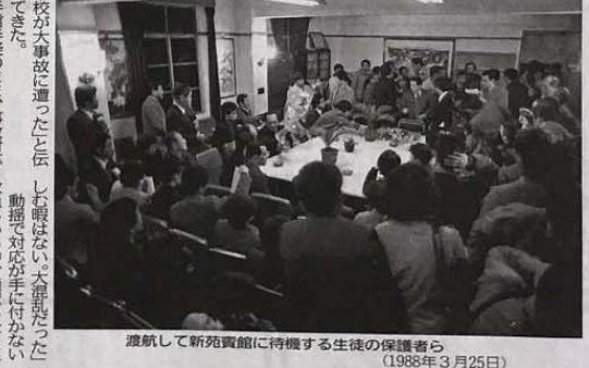
渡航して新苑賓館に待機する生徒の保護者ら(1988年3月25日)

上海の地誌新聞記者は、1988年3月26日、惨禍の後の24時間、3月24日列車事故対応の記録として題した記事を書いた。記事の中で、中国側の対応を責める内容が中心だが、その中に江蘇省の合併会社で働く中国の青年が、生じたものの面を記している。記事が、現場から事故発生後、現場に向かった重傷者を運ぶための通訳がいなかったことが、当時の混乱を引き起こした。当時の通訳不足が、現場で大きな混乱を引き起こした。