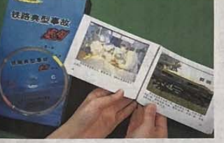
対向列車2分早く出発